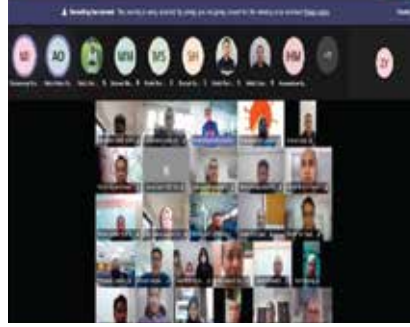
LATIHAN ATAS TALIAN 'EMPOWERING SAFETY AND HEALTH COMMITTEE' KUMPULAN UMW 29 JULAI 2021