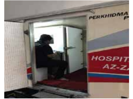
UJIAN AUDIOMETRIK LUBETECH S/B 30 SEPTEMBER 2021