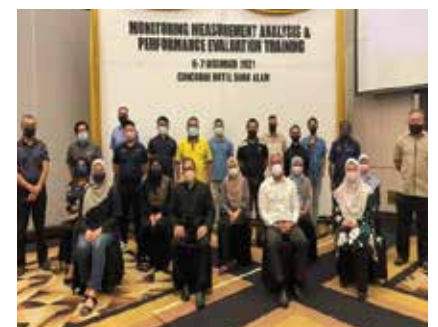
LATIHAN 'OHS MONITORING, MEASUREMENT, ANALYSIS & PERFORMANCE' KUMPULAN UMW 6 & 7 DISEMBER 2021