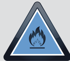
BAHAYA BILA BASAH