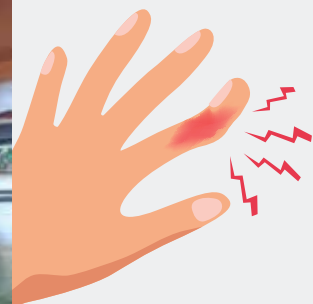
Tangan mangsa terkena objek tajam pada mesin