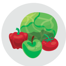
Lebihkan sayur dan buah-buahan dalam menu harian