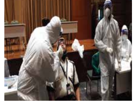
UJIAN BERKALA COVID-19 KUMPULAN UMW OGOS – DISEMBER 2021