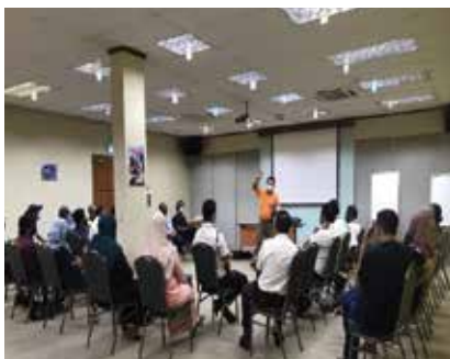
LATIHAN 'AUTOMATED EXTERNAL DEFIBRILLATOR' (AED) UMW SHAH ALAM 28 OKTOBER 2021