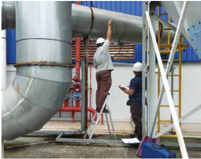
PEMANTAUAN 'LOCAL EXHAUST VENTILATION (LEV)' UMW AEROSPACE S/B 18 & 19 OGOS 2021