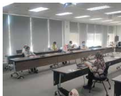
AUDIT PEMATUHAN STATUTORI ASSEMBLY SERVICES SDN. BHD. (ASSB) 2 DISEMBER 2021