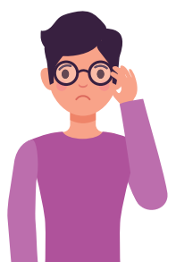
Penglihatan menjadi kabur