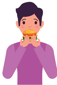
Kerap lapar dan dahaga