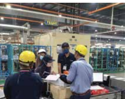
AUDIT PEMATUHAN STATUTORI TOYOTA BOSHOKU UMW 15 NOVEMBER 2021