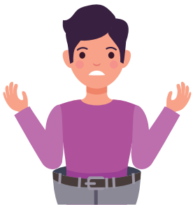
Hilang berat badan