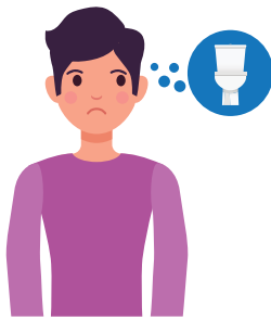
Kerap membuang air kecil pada waktu malam