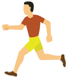
Tidak bersenam dan gaya hidup tidak aktif