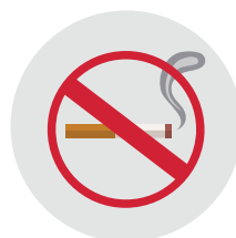
Hindari rokok dan alkohol