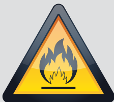
BAHAN MUDAH TERBAKAR