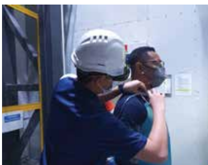
PEMANTAUAN PENDEDAHAN BAHAN KIMIA UMW AEROSPACE S/B 19 OGOS 2021