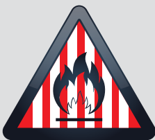
PEPEJAL MUDAH TERBAKAR