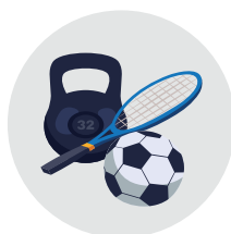
Kerap bersenam dan melakukan aktiviti fizikal