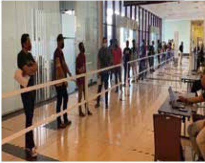
COVID-19 DOS 1 & 2, PIKAS KUMPULAN UMW 15 JULAI – 30 OGOS 2021