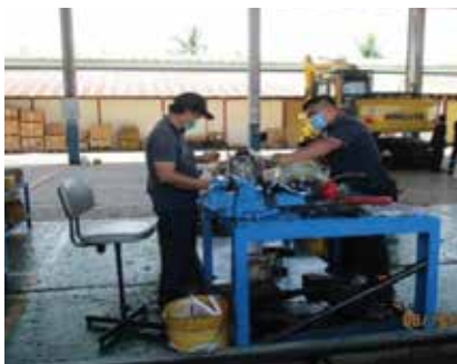
PENTAKSIRAN BUNYI BISING UMW (EAST MALAYSIA), MIRI 8 OKTOBER 2021