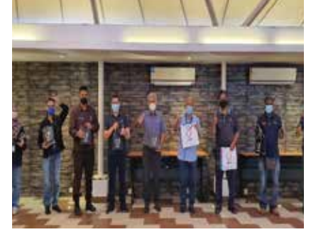
MESYUARAT DAN PERJUMPAAN TAHUNAN JAWATANKUASA KESELAMATAN DAN KESIHATAN UMW CORPORATION S/B 29 OKTOBER 2021