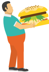
Pengambilan makanan tinggi lemak dan kurang serat