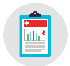
Lakukan pemeriksaan kesihatan secara berkala